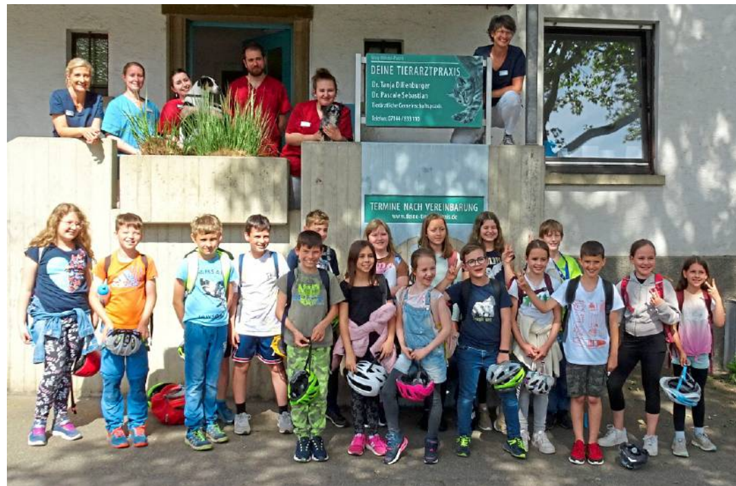
Die Klasse 4b mit dem „Deine Tierarztpraxis“-Team (links). Bei der Recherche haben die Kinder gesehen, wie Zahnputzen beim Hund funktioniert.